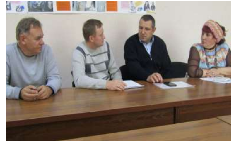
Капремонт под общественным контролем.