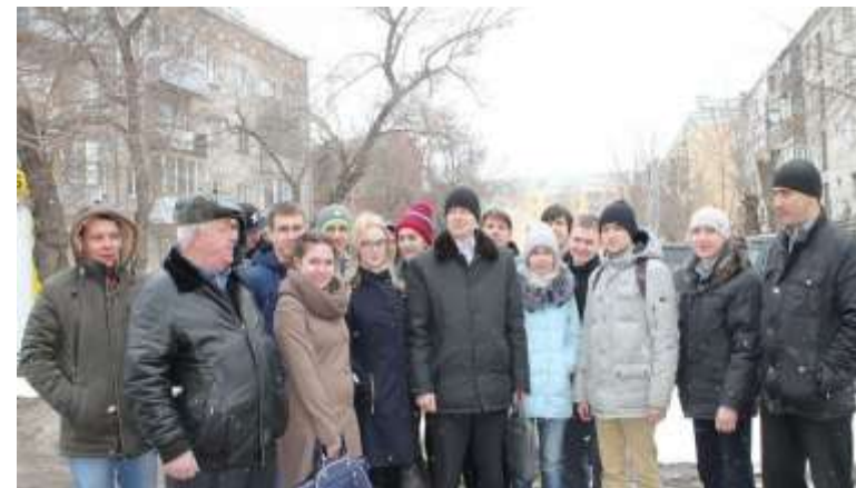
Регоператор провел «День открытых дверей»