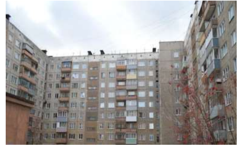
Незнание закона не освобождает от ответственности.