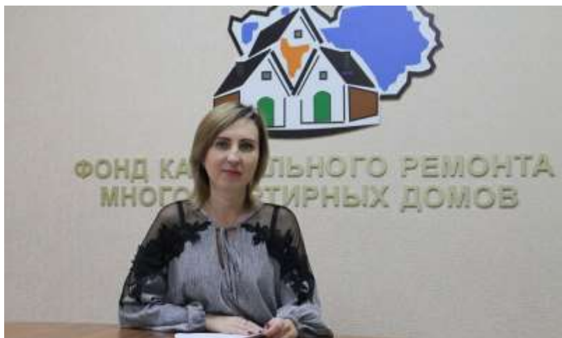
Низкая собираемость – причина переноса сроков капремонта