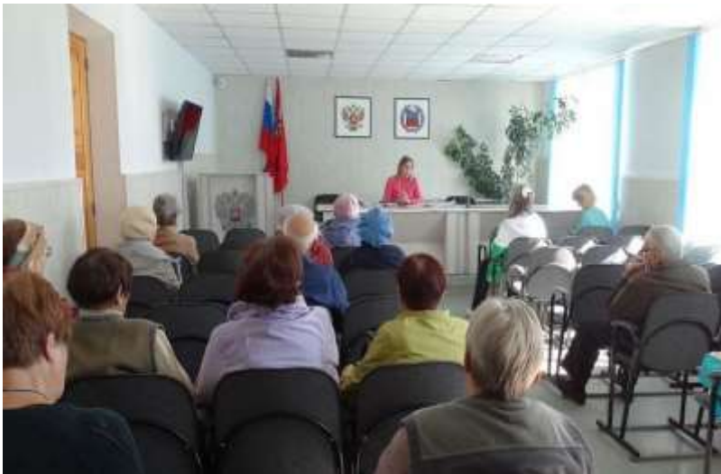
Информационно-разъяснительная работа Фонда в рамках выездных семинаров продолжается.