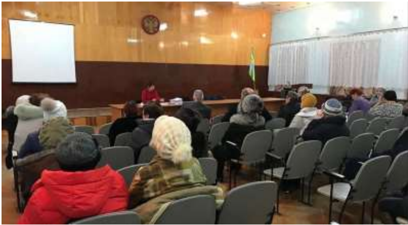
Регоператор активизирует работу с должниками