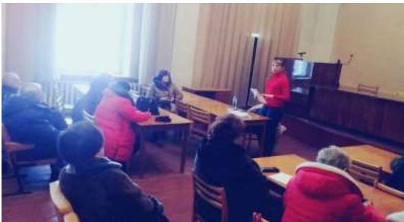
Семинар по теме капремонта прошел в Павловском районе Алтайского края