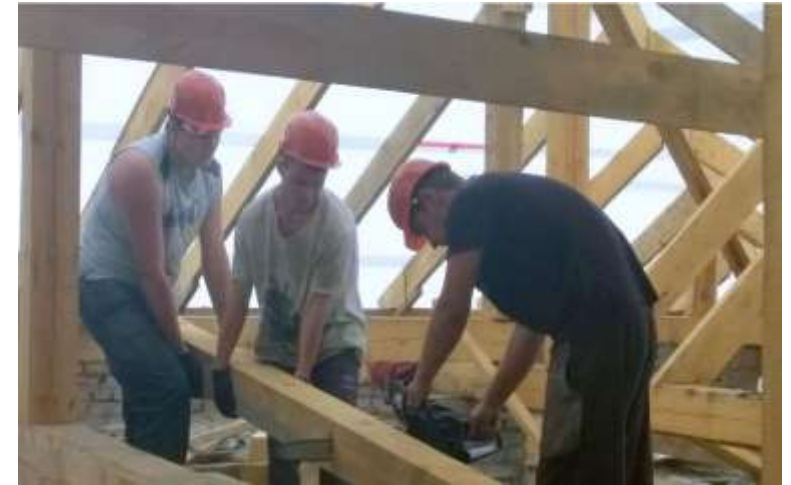
Регоператор Алтайского края улучшил позиции в рейтинге ОНФ.