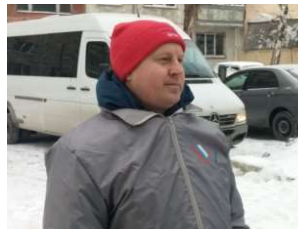
Работа Регоператора оценена экспертами Общероссийского народного Фронта.