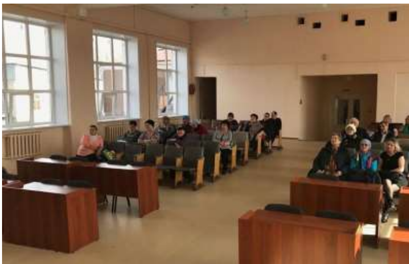
Регоператор работает над повышением уровня собираемости взносов.