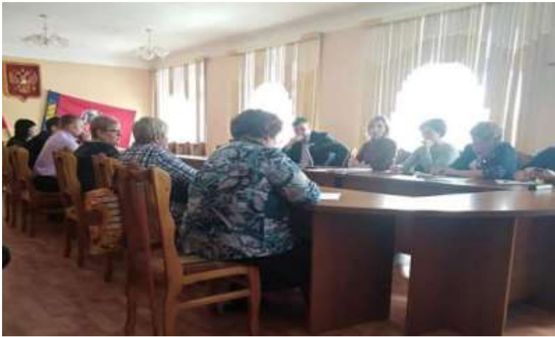
Семинар по капремонту в Алтайском и Советском районах