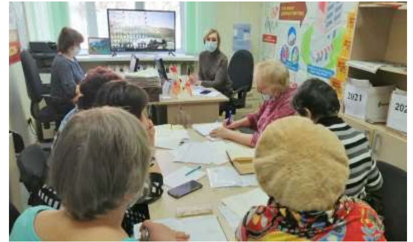
Встреча Регистратора с собственниками в "Центре защиты прав граждан в Алтайском крае"