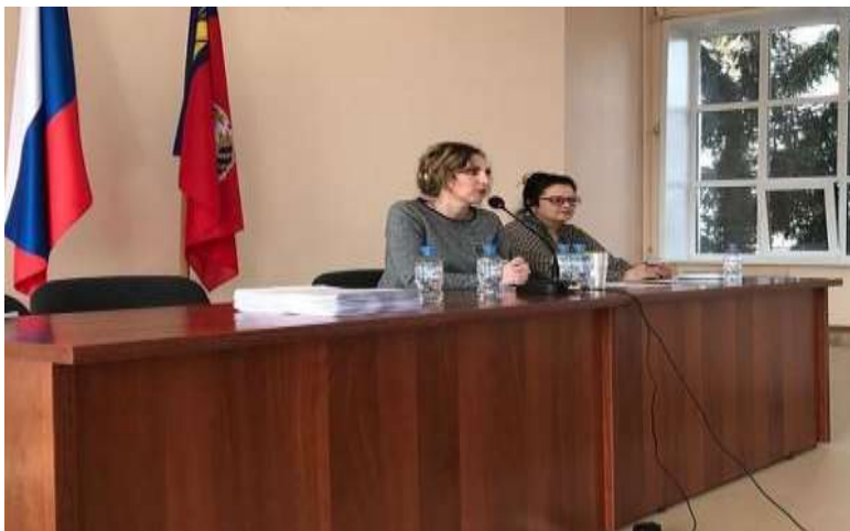
Разъяснительная работа как способ повышения собираемости.