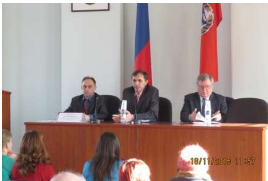
Рисунок 2 – Семинар в г. Рубцовске