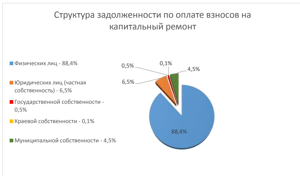
ДИАГРАММА РАСПРЕДЕЛЕНИЯ ЗАДОЛЖЕННОСТИ ПО ДОЛЯМ

За ненадлежащее исполнение обязанностей по оплате взносов на капитальный ремонт за период с декабря 2014 по ноябрь 2015 г. Региональным оператором начислено пени в размере 3 млн. 434 тыс. руб., из которых в добровольном порядке собственниками оплачено 1 млн. 655 тыс. руб.