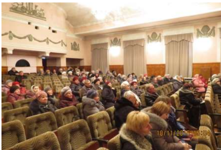
Рисунок 1 – Семинар в с. Завьялово