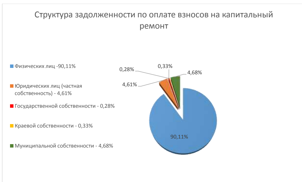
ДИАГРАММА РАСПРЕДЕЛЕНИЯ ЗАДОЛЖЕННОСТИ ПО ДОЛЯМ

Во исполнение требований ч.4 ст. 181 Жилищного кодекса РФ Региональным оператором организована работа по принудительному взысканию с собственников помещений в МКД, включенных в Краевую программу капитального ремонта, задолженности по оплате начисленных взносов на капитальный ремонт.