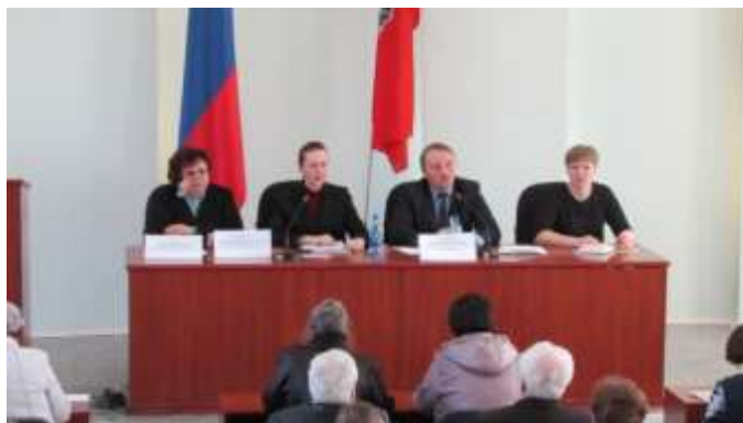
Семинар в г. Рубцовске

Деятельность Регионального оператора нашла освещение и в СМИ – в отчетном периоде в эфир вышло 60 новостных сюжетов, посвященных деятельности Регионального оператора и реализации Краевой программы капитального ремонта. Руководители Регионального оператора дали 48 интервью для региональных СМИ.